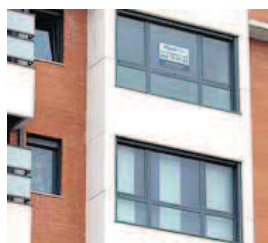
Viviendas en venta.

CC OO resumió que los reconocimientos «nunca deben suponer una carga, coste o consecuencia negativa y perjudicial para la plantilla».