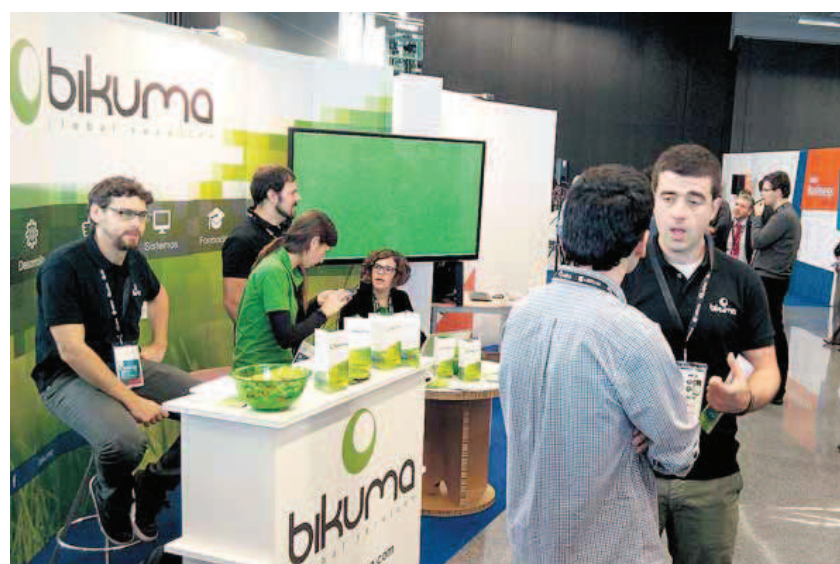
Más de 2.000 profesionales participan en el congreso de software libre y tecnología abierta LibreCon.

En septiembre se incrementaron, sobre todo, las operaciones en el mercado de vivienda usada. En concreto, las 676 compraventas formalizadas suponen un 41,12% más que el año anterior.